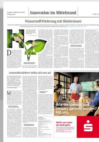
Umsetzung F.A.Z. 1.3.2022

Druckunterlagenschluss: Mittwoch, 22. Februar 2023