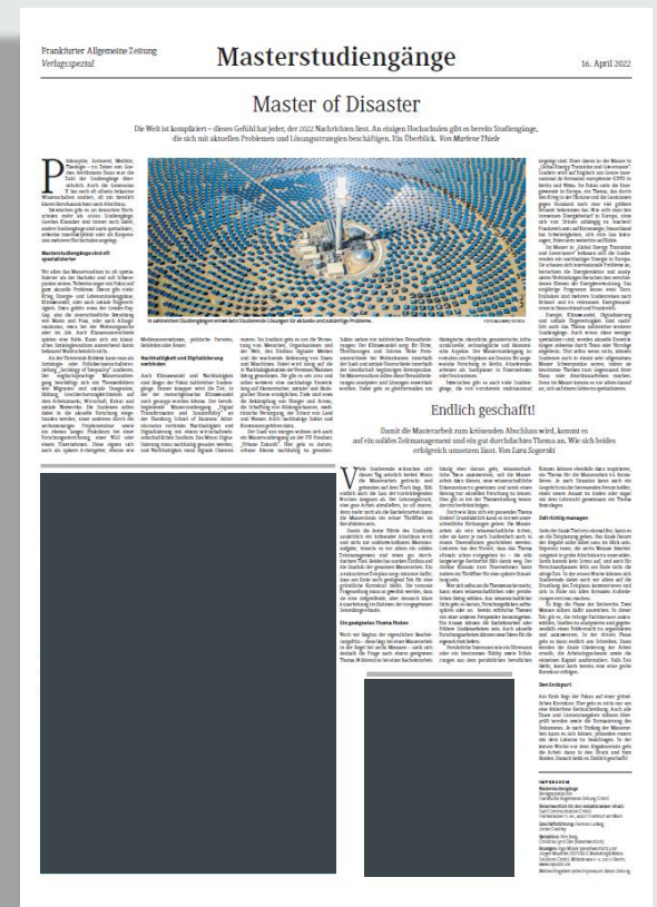
Ansichtsbeispiel „Masterstudiengänge“ vom 16./ 17. April 2022

Alle Preise zzgl. ges. USt. Es gelten die Geschäftsbedingungen der aktuellen Anzeigen-Preisliste der F.A.Z. von 2022 unter www.republic.de . Formate und technische Angaben unter www.republic.de/mediadaten