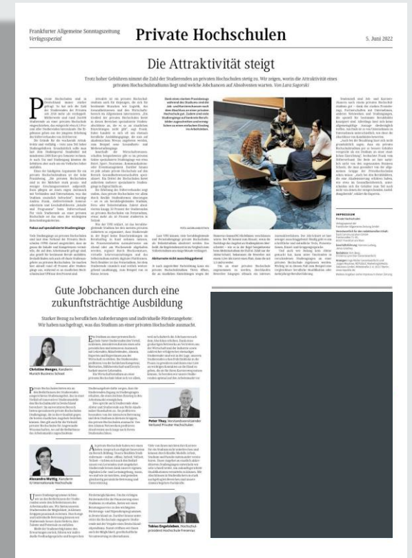
Ansichtsbeispiel F.A.Z./F.A.S.-Verlagsspezial „Private Hochschulen“ vom 4./5. Juni 2022

Alle Preise zzgl. ges. USt. Es gelten die Geschäftsbedingungen der aktuellen Anzeigen-Preisliste der F.A.Z. von 2023 unter www.republic.de . Formate und technische Angaben unter www.republic.de/mediadaten