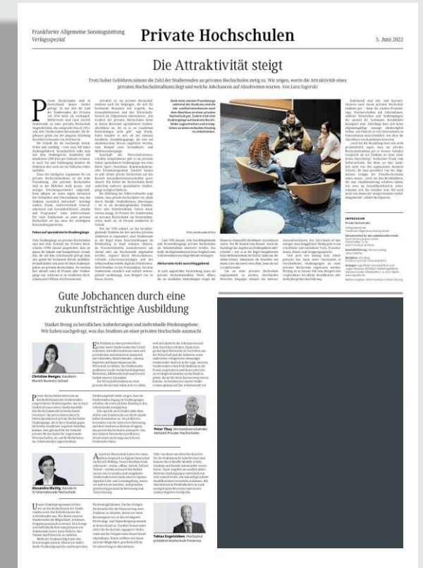
Ansichtsbeispiel F.A.Z./F.A.S.-Verlagsspezial „Private Hochschulen“ vom 4./5. Juni 2022

Alle Preise zzgl. ges. USt. Es gelten die Geschäftsbedingungen der aktuellen Anzeigen-Preisliste der F.A.Z. von 2023 unter www.republic.de . Formate und technische Angaben unter www.republic.de/mediadaten