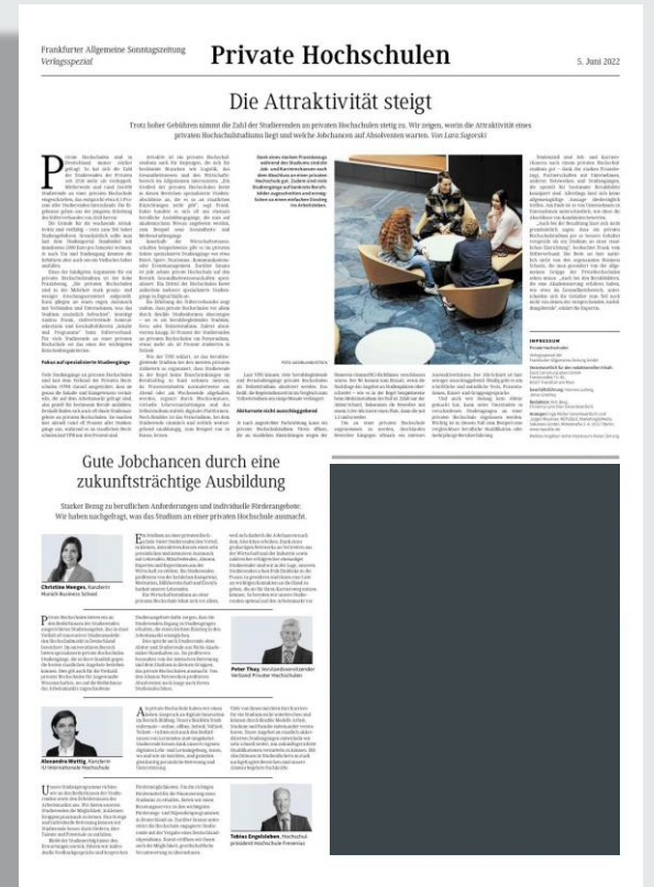
Ansichtsbeispiel F.A.Z./F.A.S.-Verlagsspezial „Private Hochschulen“ vom 4./5. Juni 2022

Alle Preise zzgl. ges. USt. Es gelten die Geschäftsbedingungen der aktuellen Anzeigen-Preisliste der F.A.Z. von 2023 unter www.republic.de . Formate und technische Angaben unter www.republic.de/mediadaten