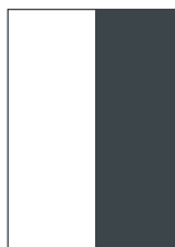
1/2 Seite hoch 18.030 Euro